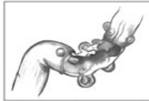
Esta vista de cerca muestra una parte del colon donde se han formado bolsillos. Estos bolsillos se llaman divertículos.